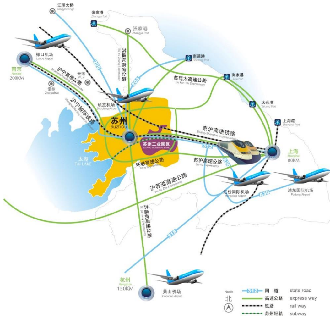
图1 苏州工业园区的区位与交通

苏州工业园区（Suzhou Industrial Park）是1994年2月经国务院批准设立的国家级经济技术开发区。园区地处长江三角洲地区，位于苏州市主城区以东的金鸡湖畔，东临昆山和上海，拥有发达的高速公路、铁路、水路及航空网（见图1）。园区行政区划面积278平方公里，包含80平方公里的中新（China-Singapore）合作区和四个街道。