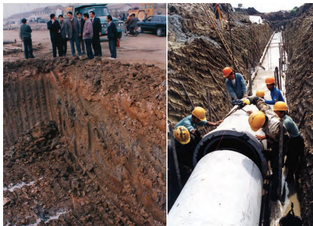
图 6 1994 年园区“九通一平”的埋管沟槽深至 9 米

园区借鉴裕廊的基础设施先行理念，通过高标准的建设水平提升自身竞争力。这一阶段是园区以基础设施建设为特征的工业化快速启动阶段。对于资金十分紧张的园区来说，严格遵循规划开展高标准建设，走一条与当时国内其他开发区所不同的道路，需要观念上的巨大转变（见专栏）。事实上，这种从裕廊借鉴到的高标准建设理念，被证明是吸引外资的核心因素。在“九通一平”标准下（见图 6），园区成为当时国内基础设施水平最高的开发区之一。至 2000 年底，园区累计投入基础设施建设资金 78.3 亿元，累计进区企业 4791 家，累计合同利用和实际到帐外资分别达 76 亿美元和 39.7 亿美元，当年完成工业总产值 316.1 亿元，实现 6 年翻三番。