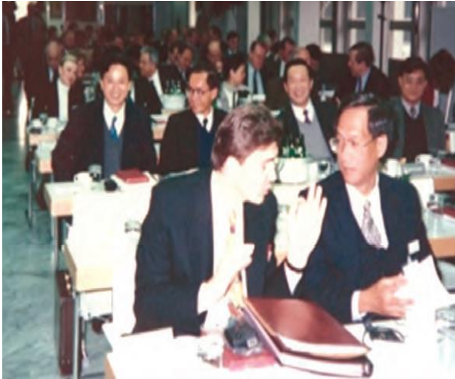
图7 1994年4月首次中新联合招商（1994）

1994年4月11~20日，新加坡总理吴作栋赴欧洲访问德国和英国，并为苏州工业园区进行招商，代表团成员有新加坡-苏州开发财团执行委员会主席林子安、新加坡软件项目办公室主任林瑞生、裕廊镇管理局局长林得恩等有关部门官员。应新方邀请，江苏省对外经济贸易委员会主任叶坚、园区筹委会副主任周迅、苏州工业园区开发有限公司（筹）负责人孔永林随团参加招商活动。这是中新双方首次进行联合招商（见图7）。