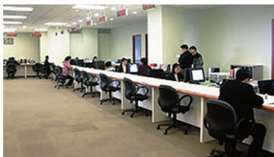
图11 园区“一站式”服务中心

园区按照“精简、统一、效能”的原则，形成了“大部制保障、信息化支撑、不见面审批、专业化服务、平台型监管”特色。1995年起，园区在国内率先推行“一站式”服务，并于2000年设立“一站式”服务中心（见图11），由管委会各相关部门及工商管理机构分别设立服务窗口，集中受理申办事项。近年来，园区推进大部门制机构改革，设立大经济发展、大规划建设、大文化管理、大行政执法、大市场监管等部门，逐步形成了“一枚印章管审批、一支队伍管执法、一个部门管市场、一个平台管信用、一张网络管服务”的“五个一”治理架构。推行“网上办、集中批、联合审、区域评、代办制、不见面”的审批服务模式。同时，园区以开展相对集中行政许可权改革试点为契机，大力实施审批流程再造，推进简政放权，将原来涉及的近30个处室、90多名审批人员、16枚审批印章，精简为3个业务处室、30多名审批人员、1枚审批印章，大幅降低了企业制度性交易成本。积极探索“2333”改革，即企业2个工作日内注册开业，3个工作日内获得不动产权，33个工作日内取得工业生产建设项目施工许可证。