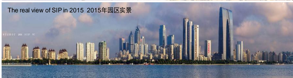
图 10 苏州工业园区实景与规划对比

“规划规划，不能只是墙上挂挂。”时任市委常委、苏州工业园区党工委书记王翔表示，“园区开发至今已有 20 年，领导班子调整过多次，但开发区发展格局与当初规划设计几乎一模一样。正是有着这样的法治思维，苏州工业园区才能实现‘一张蓝图干到底’。”