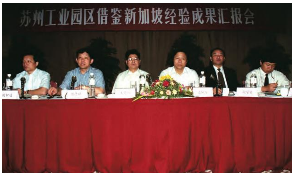
图 14 1998 年借鉴新加坡经济和公共管理经验成果汇报会

经济的持续增长，并探索现代经济管理体系，形成了具有新加坡特色的发展经验。经过近 50 年的努力，裕廊地区从沼泽荒地发展成为高度发达的工业镇，产业类型也从早期的木材、食品粗加工、零部件维修发展到机械制造、仪器仪表、医药、炼油设备、电脑、生物工程等。新加坡政府以裕廊工业镇的管理经验为基础，进一步推广和充实，形成了一整套国民经济建设和发展的成功经验。中国设立经济特区和开发区，就是按照邓小平“划出一块地方”、“杀出一条血路来”这一思想来推进的，在一定区域，辅以特殊的政策，大胆闯大胆试，以局部的突破来求得整体的发展。中新合作建设苏州工业园区的成功，正如苏州市政府研究室主任卢宁所认为的，“让苏州认识到要更加坚定地走开发区道路。”