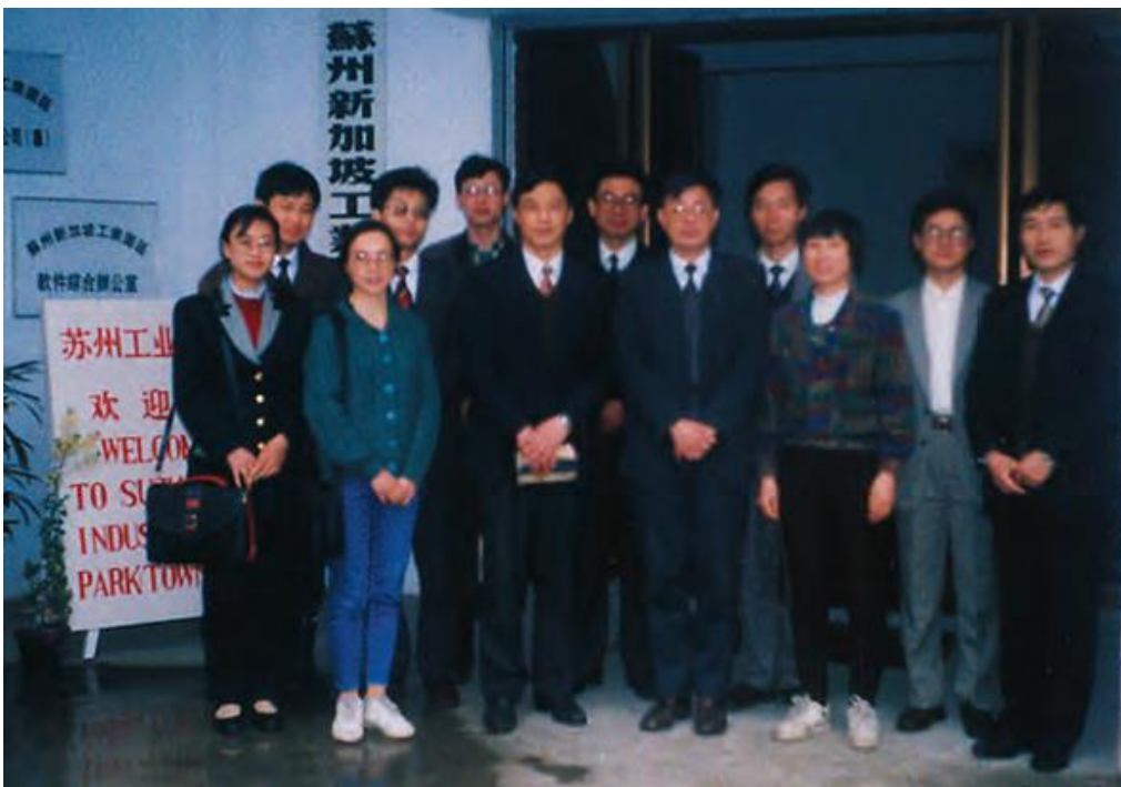
图 3 1994 年首批赴新加坡培训学员启程

主席，负责传达国家意图，确定借鉴经验的目标和范畴，协调解决发展中的项目审批、财政税收、外事管理、物流通关等重大问题。中层机制方面，中新双边工作委员会负责计划设计，工作委员会由苏州市政府市长和新加坡裕廊镇管理局主席（后调整为新加坡贸易与工业部常任秘书）担任双边主席，负责制定和落实借鉴新加坡经验的工作计划，监督借鉴新加坡经验工作计划的实施。基层机制方面，双方联络机构执行具体工作，联络机构由园区借鉴新加坡经验办公室和新加坡贸工部软件项目办公室构建，负责具体执行新加坡经验的借鉴培训，组织园区官员和专业管理人员赴新加坡参加培训的日常工作。园区成立的当年，第一批学员就赶赴新加坡接受培训（见图 3）。