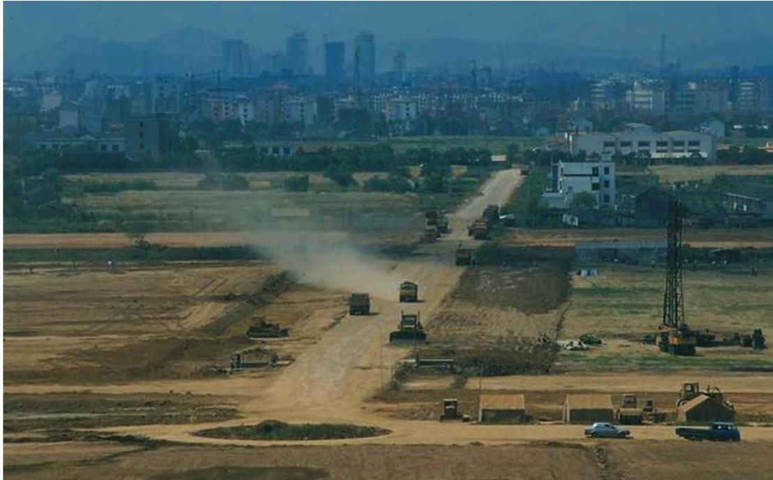
图 4 1994 年首期启动区填土和土地平整

园区借鉴裕廊的基础设施先行理念，通过高标准的建设水平提升自身竞争力。这一阶段是园区以基础设施建设为特征的工业化快速启动阶段。对于资金十分紧张的园区来说，严格遵循规划开展高标准建设，走一条与当时国内其他开发区所不同的道路，需要观念上的巨大转变（见专栏）。事实上，这种从裕廊借鉴到的高标准建设理念，被证明是吸引外资的核心因素。在“九通一平”标准下（见图 6），园区成为当时国内基础设施水平最高的开发区之一。至 2000 年底，园区累计投入基础设施建设资金 78.3 亿元，累计进区企业 4791 家，累计合同利用和实际到帐外资分别达 76 亿美元和 39.7 亿美元，当年完成工业总产值 316.1 亿元，实现 6 年翻三番。