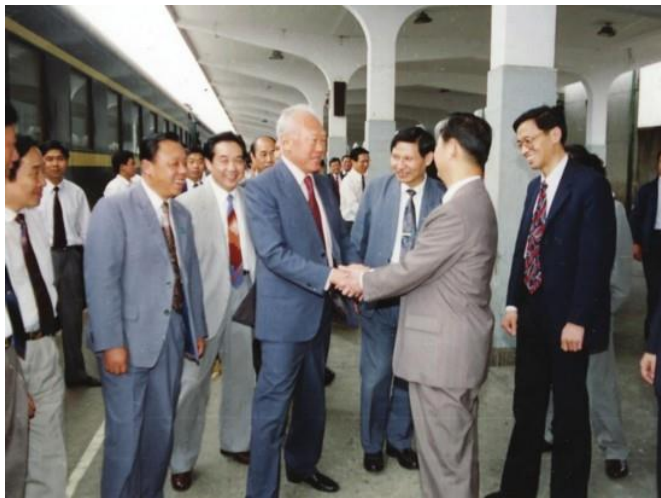
图 2 1992 年李光耀首次访问苏州

1992 年 10 月 1 日，李光耀首次访问苏州（见图 2），为合作建设园区提供了重要契机。园区正式成立后，从打下开发建设的第一根桩起，李光耀就一直很挂念苏州工业园区，他的足迹遍布苏州工业园区开发建设热土。他考察过太湖取水口，并参加了苏州工业园区供水项目太湖取水口揭牌仪式；他见证了苏州工业园区水厂和污水处理厂的落成；他亲手在金鸡湖畔种下绿树；他还在新加坡国际学校发表了演讲。2009 年 5 月 25 日至 26 日，李光耀来苏出席苏州工业园区成立十五周年庆祝大会。他还乘船游览了金鸡湖夜景，并观赏了水景表演。